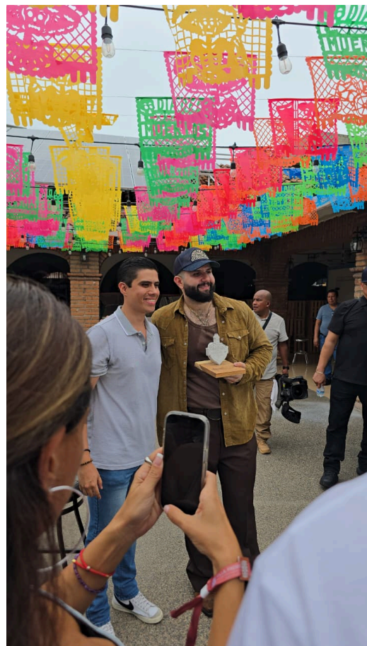
6. grabación de video musical en mercado Emiliano Zapata.