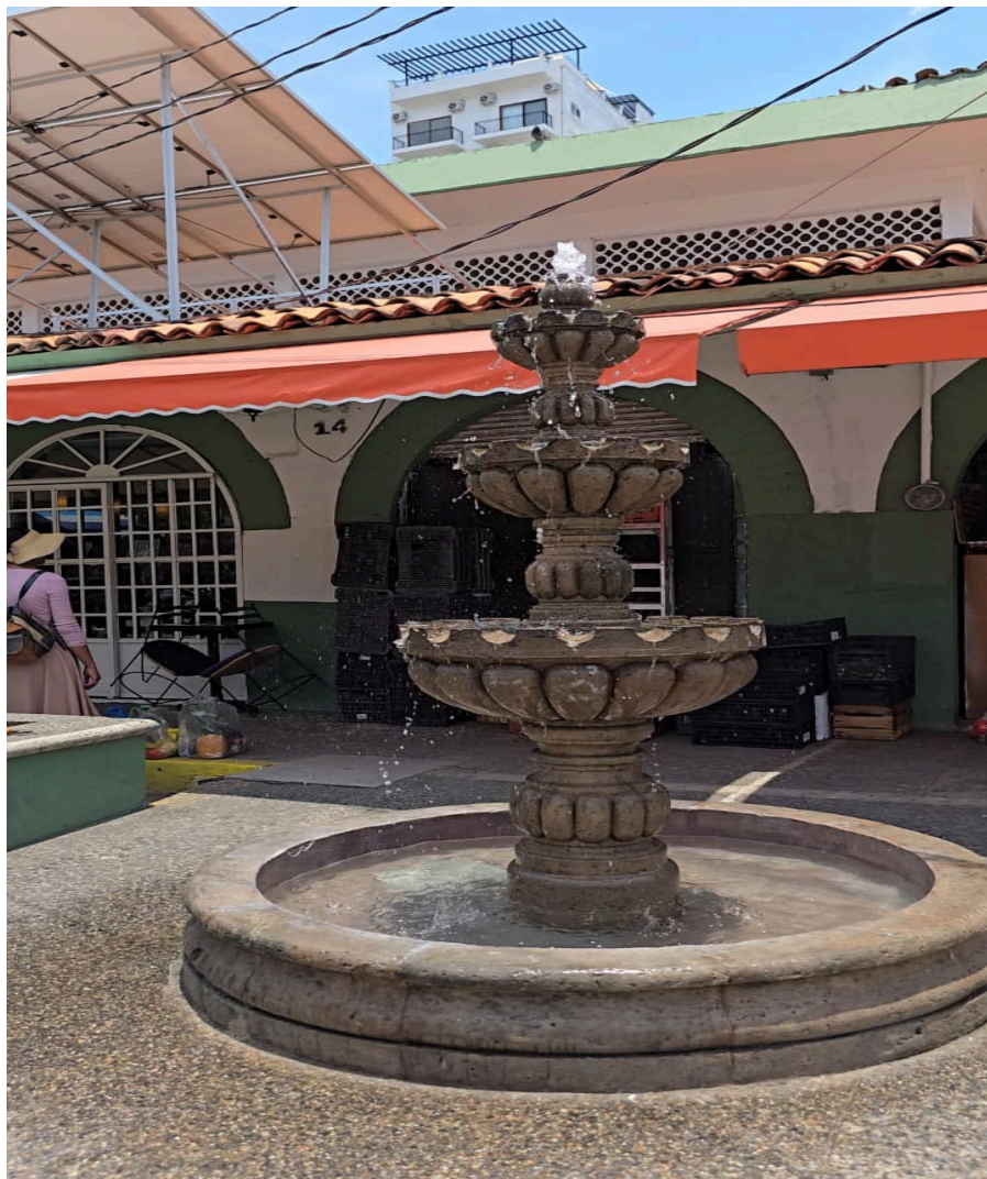
8. rehabilitación de fuente mercado Emiliano zapata.